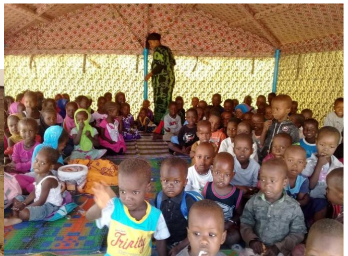
Hangar provisoire actuel de la garderie d'enfants financé à hauteur de 50% par Arémau