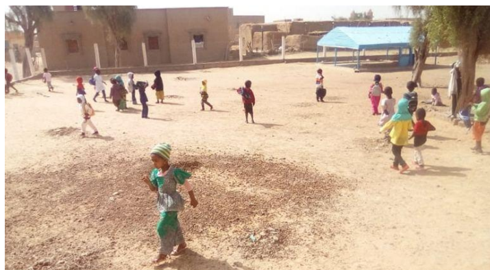
Dans la cour