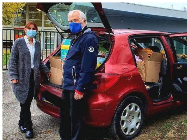
A la crèche