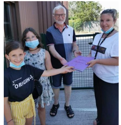
Courrier pour Thialgou 09 juillet 2021