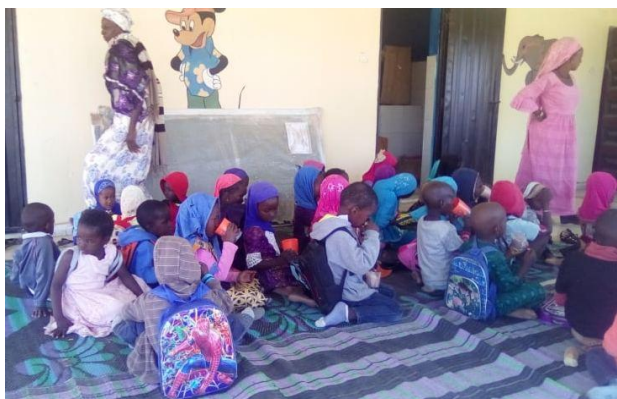
Le temps du goûter