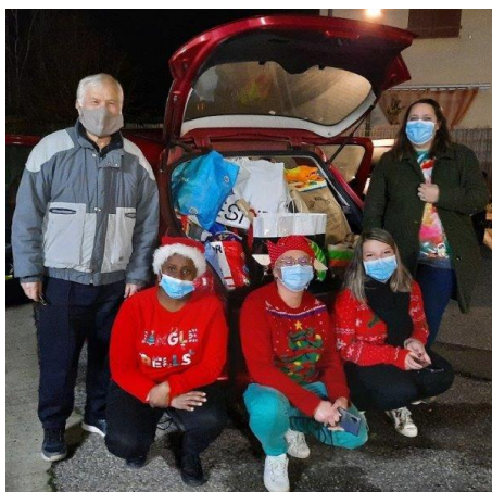
Au centre de Loisirs

Au début janvier le Centre de Loisirs et la crèche de Bruguières ont fait un don à notre association de jouets et de livres collectés auprès des enfants et de leurs parents.