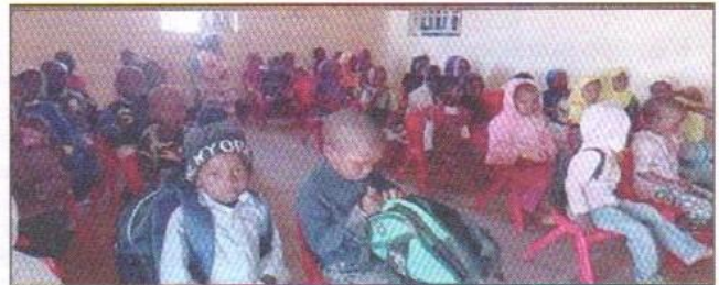
L'association Aremau a tenu son assemblée générale 2020

nançière aux thialgois les plus défavorisés privés d'emploi en raison des restrictions sanitaires.