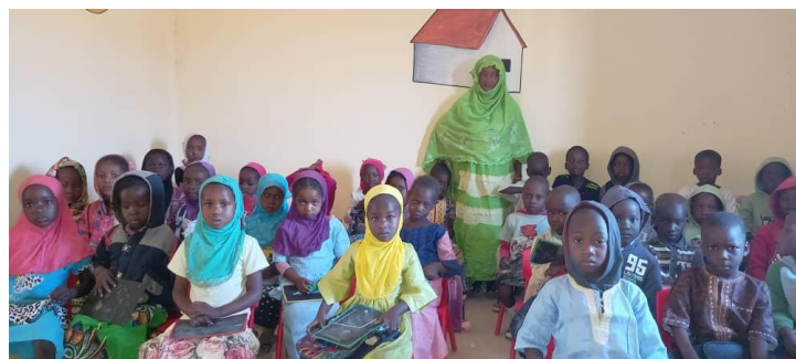
Classe des enfants de 3 et 4 ans (Le tableau : don d'une école en Gironde) Classe des enfants de 5 ans