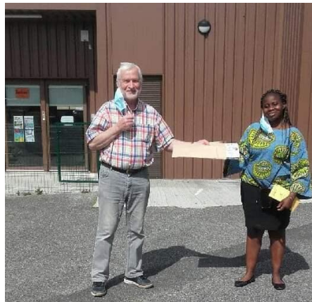
Courrier en provenance de Thialgou 28 mai 2021