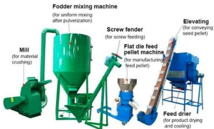
Ensemble des machines d'auto production