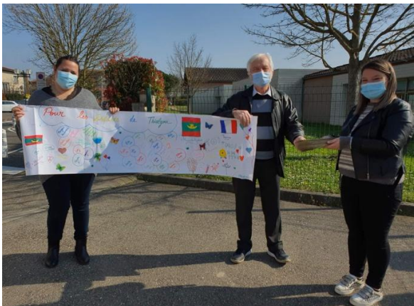
Courrier pour Thialgou 08 mars 2021

Je vous adresse mes sincères salutations à transmettre à vos collègues.