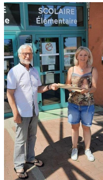
Prise en charge des réponses 02 juillet 2021