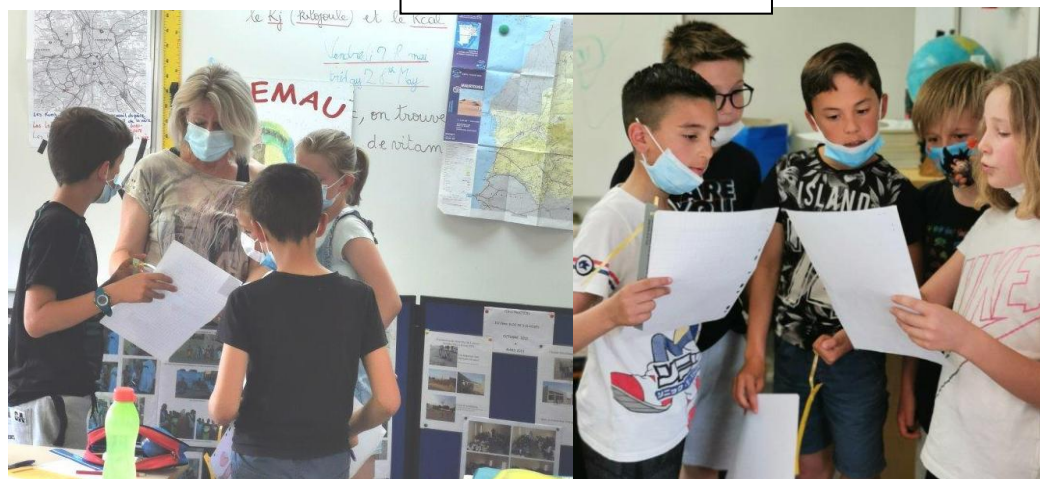
Réception du courrier de Thialgou par les élèves de Montberon 28 mai 2021